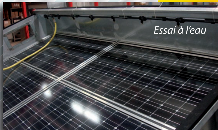
Essai à l'eau

i-3S - Groupe HAC, au capital de 1 000 000 € - SIRET : 422 702 589 00041