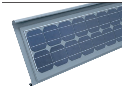
Cellules de silicium cristallin, adaptées au RHEINZINK®-prépatiné PRO