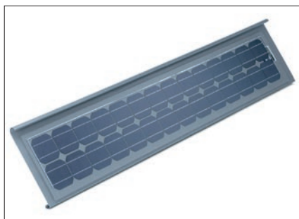
Le panneau QUICK STEP - PV Solaire en 2000 mm x 365 mm