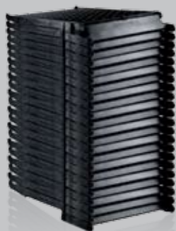
Expédié par palette de 22 éléments

Conception aérodynamique résistante aux vents violents. Le matériau, un alliage verre-polymère solide assure une longue vie au produit. L'écoulement de l'eau est facilité par l'inclinaison du module et permet ainsi de minimiser la formation de dépôts.