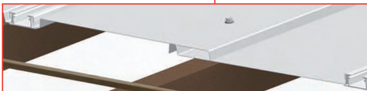
Bac Aluminium : étanchéité, durabilité