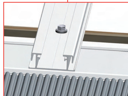
Profilé à haute résistance mécanique