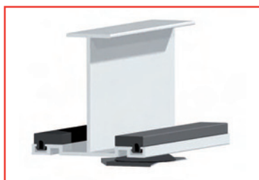
Clips de fixation universel