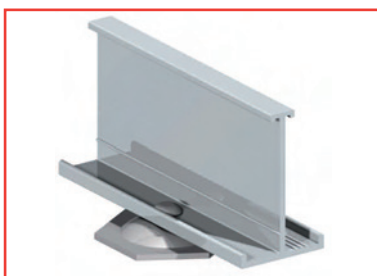
Clips de fixation modules Schüco